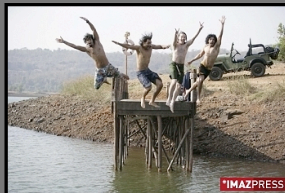
Le film indien "Rock on" sera présenté au Festival du film de La Réunion 2009