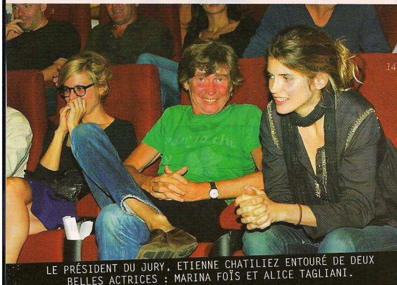
LE PRÉSIDENT DU JURY, ETIENNE CHATILIEZ ENTOURÉ DE DEUX BELLES ACTRICES : MARINA FOÏS ET ALICE TAGLIANI.