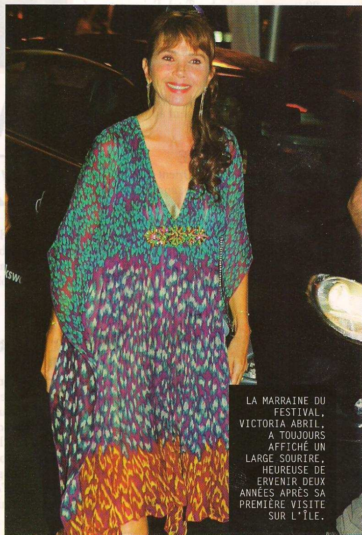
LA MARRAINE DU FESTIVAL, VICTORIA ABRIL, A TOUJOURS AFFICHÉ UN LARGE SOURIRE, HEUREUSE DE ERVENIR DEUX ANNÉES APRÈS SA PREMIÈRE VISITE SUR L'ÎLE.