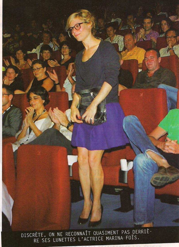
DISCRÈTE, ON NE RECONNAÎT QUASIMENT PAS DERRIÈRE SES LUNETTES L'ACTRICE MARINA FOÏS.