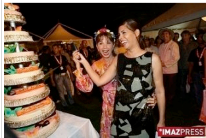
Mardi 3 Novembre 2009 Soirée du Festival du film de la Réunion

Le Mascarin du meilleur film vaut à son réalisateur une prime de 10 000 euros attribuée par la Fondation d'Entreprise France Télévisions. Les Prix des meilleures interprétations féminine et masculine sont remis par le magazine "Marie Claire".