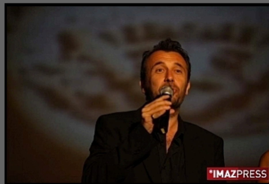
Festival du film de La Réunion