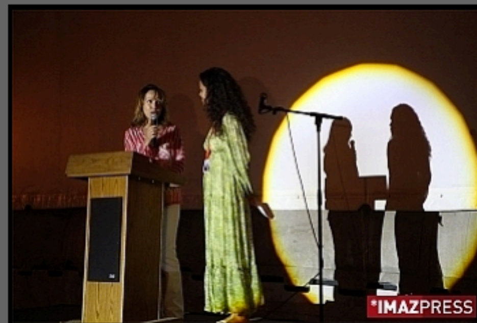
Mercredi 3 novembre 2010 - projection de "Comme un torrent" sur la plage des Brisants à Saint-Gilles-les-Bains