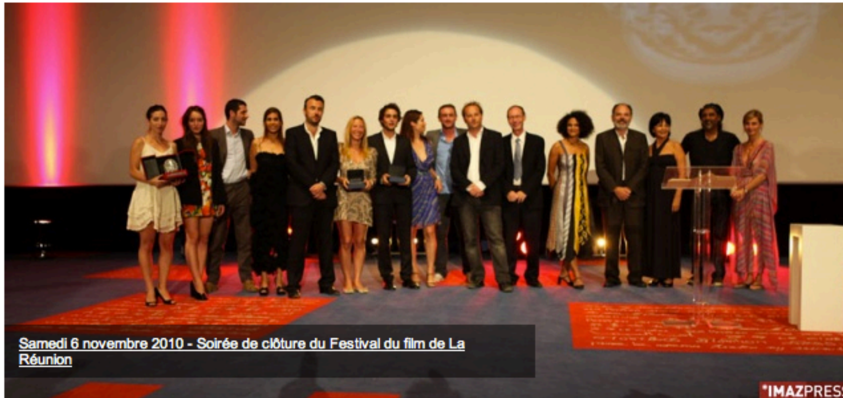
Samedi 6 novembre 2010 - Soirée de clôture du Festival du film de La Réunion